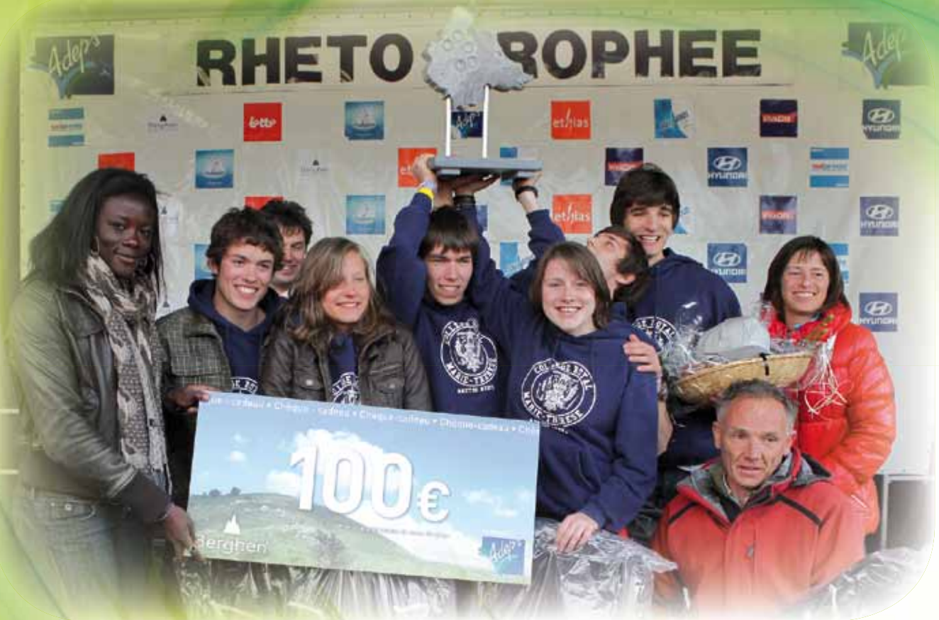
Collège Royal Marie-Thérèse, Herve, vainqueur 2010.

POUR TOUTE QUESTION CONCERNANT LES ÉPREUVES, N'HÉSITÉS PAS NOUS CONTACTER